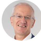
Giordano LOMBARDO CEO, Plenisfer Investments

„Eine neue Ära des Investierens erfordert einen neuen Anlagestil. In einer stärker korrelierten Welt müssen aktive Investments darauf ausgerichtet sein, Ergebnisse zu erzielen und sich nicht auf die relative Performance zu konzentrieren. Unser «New Active»-Anlageprozess legt den Schwerpunkt auf die Zusammenstellung von Portfolios, die klare Ziele im Einklang mit den sich ändernden Bedürfnissen der Anleger erreichen.“